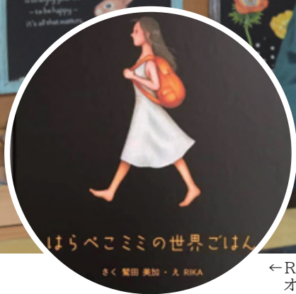
←RIKAさんが絵を担当し出版された絵本「はらべこミミの世界ごはん」。県内書店およびネット書店で販売中。オイルパステルを指で混色する技法による絵本出版は日本初。