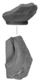
写真2 出土遺物(陶器)

問い合わせ 生涯学習課(生涯学習センターコスモス内) ☎ 0299-26-9111