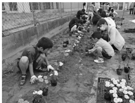
子どもから大人までみんなで活動しています