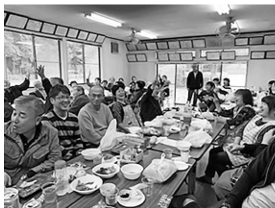
三世代交流会（張星区）

4月18日に区長会長に選任されました。新型コロナウイルスの影響で緊急事態宣言が発令される中、拡散防止対策として紙面総会という誰もが予測しえない状況の中でのスタートとなりましたが、このような時こそ地域やコミュニティの絆を最大限に活かす時だと感じています。そのためにも、みなさんのより一層のお力添えをいただき、この危機を乗り越えていきたいと思っております。